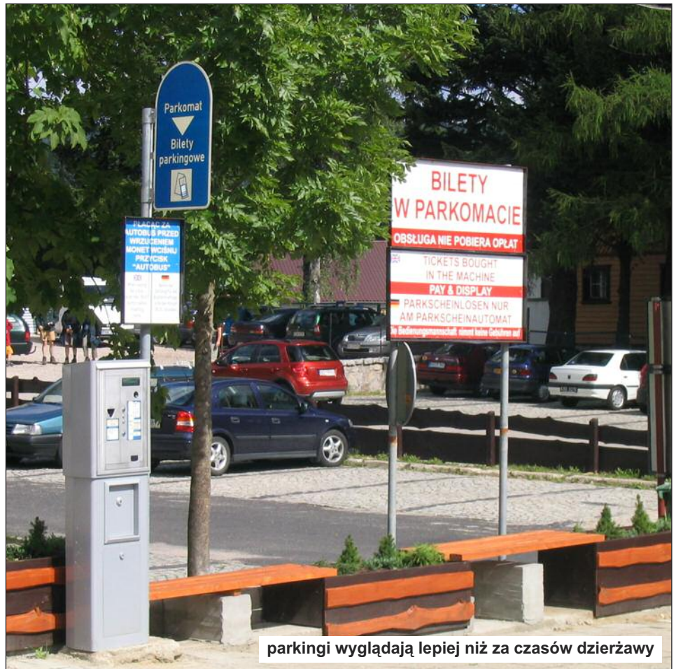
parkingi wyglądają lepiej niż za czasów dzierżawy