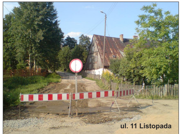
ul. 11 Listopada