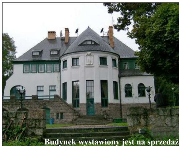
Budynek wystawiony jest na sprzedaż

Spółka Prestomax prowadząca klinikę WZROK, mimo wielu spotkań i propozycji, nie zdecydowała się na dalszą dzierżawę. Opuściła obiekty a przedstawiona przez nią wycena poniesionych nakładów sięgnęła kwoty niemal 2 milionów złotych za wszystkie nieruchomości. Władze miasta zakwestionowały nie tylko tę wycenę, ale także fakt swojej odpowiedzialności za zobowiązania wynikające z umów zawartych przez FWP. Okazało się bowiem,