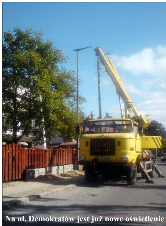
Na ul. Demokratów jest już nowe oświetlenie

W październikowym biuletynie (13/09) zaprezentowaliśmy inwestycje, jakie są realizowane przy wykorzystaniu różnych do-