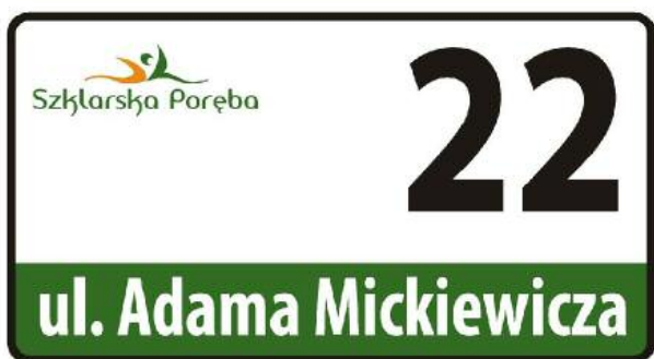
Tak powinny być teraz oznakowane budynki