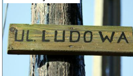
Trzeba sobie jakoś radzić

tablic za właścicieli domów. Nie można nawet wskazać firmy, która to będzie robić.