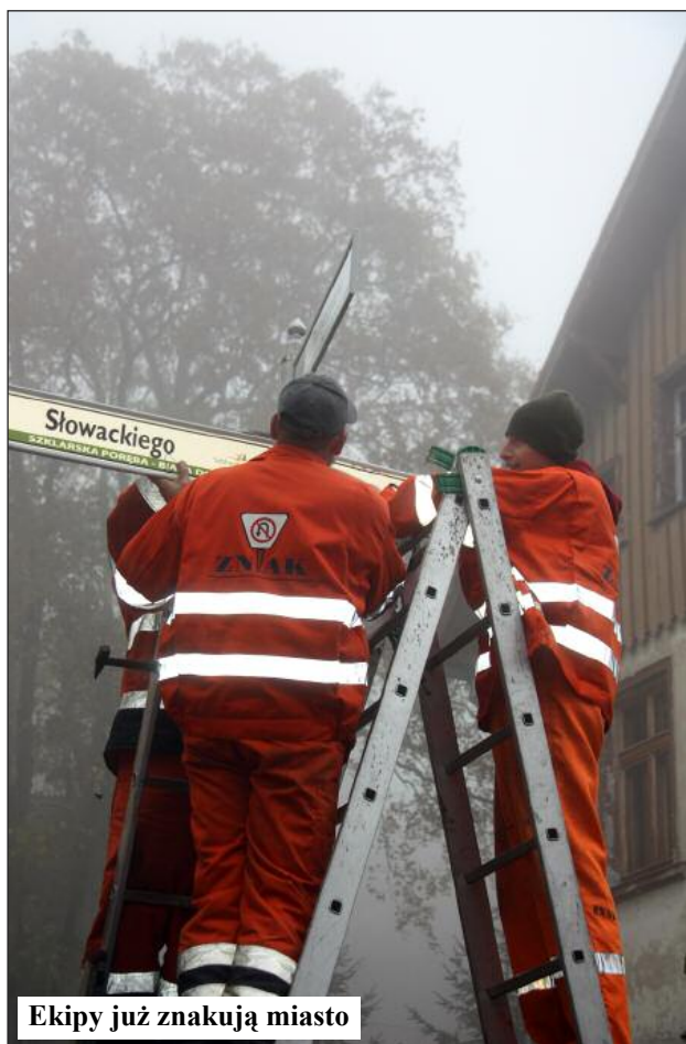
Ekipy już znakują miasto

Nawigacja satelitarna dziś montowana jest w telefonach i fabrycznie instalowana w nowych samochodach. Jednak jeszcze długo wielu naszych gości posługiwać się będzie zwykłymi mapami. Ponadto nie wszyscy do nas przyjeżdżają samochodami. Po trzecie wreszcie: nie trudno sobie wyobrazić, że system satelitarny zawodzi i co wówczas? Dlatego oznakowanie miasta jest niezbędne. Jeszcze przed sezonem zimowym zostaną wymienione tablice z nazwami ulic. W momencie oddawania biuletynu do druku, już nowe tablice pojawiły się w kilkudziesięciu punktach Białej Doliny.