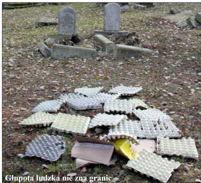
Glupota ludzka nie zna granic

Wracamy do tematu dawnego cmentarza ewangelickiego w Szklarskiej Porębie Dolnej. W poprzednim numerze biuletynu opisywaliśmy problemy z związane z jego ponownym uruchomieniem. W skrócie: są chęci, ale projekty sprzed lat są nieaktualne. Całą procedurę trzeba przeprowadzić od początku, tymczasem nie ma