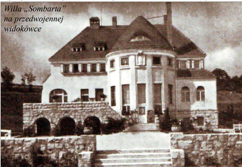
Willa „Sombarta” na przedwojennej widokówce

stępowania eksmisyjne. Dopiero groźba komorniczej egzekucji spowodowała, że byli dzierżawcy zaczęli opuszczać budynki. Ostatnie dopiero w roku 2012.