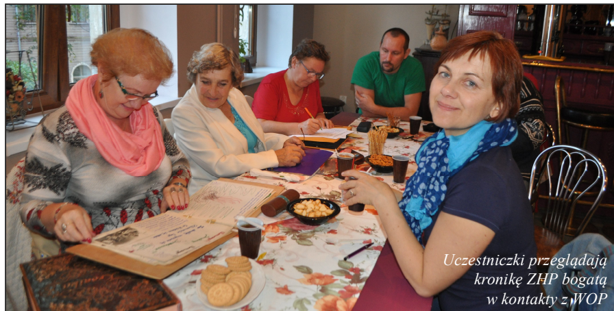
Uczestniczki przeglądają kronikę ZHP bogatą w kontakty z WOP

Na adres podany w apelu piszą byli żołnierze WOP rozsiani po całym kraju, dzielą się wiedzą i wskazują dalsze kontakty. Obecnie liderzy ds. albumu opracowują projekt tego działania. Podajemy adresy e-mail do kontaktów: sekretarz@szklarskaporeba.pl; zbzzjg@wp.pl; wolontariat@lokalniniemebanalni.pl