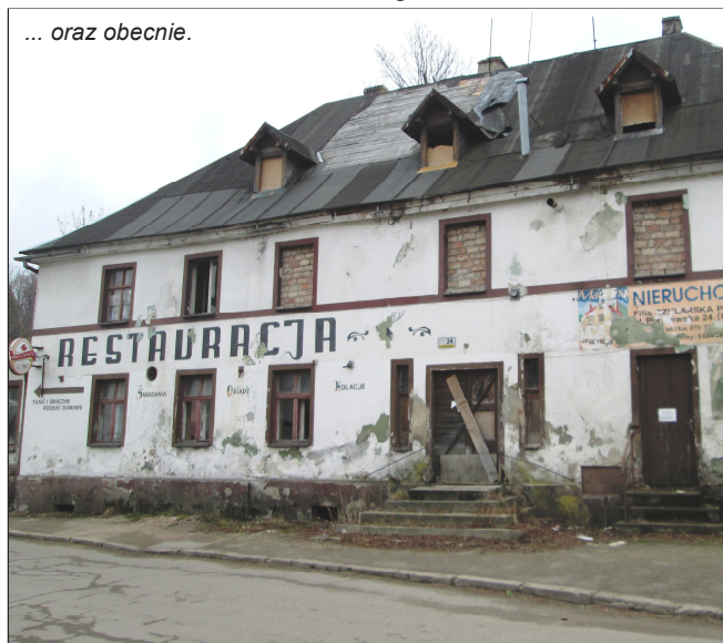
... oraz obecnie.