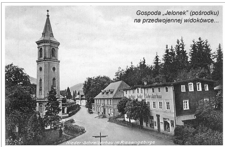
Gospoda „Jelonek” (pośrodku) na przedwojennej widokówce...

Gmina swoją część budynku zabezpieczyła przed wejściem osób niepowołanych. Druga część obiektu należąca do osoby prywatnej jest niezabezpieczona i grozi zawaleniu. Budynek nie tylko szpeci tę część miasta, lecz stwarza realne zagrożenie dla życia i zdrowia ludzi. Sprawa oczywiście w ten sposób nie zostanie pozostawiona.