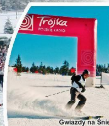
Gwiazdy na Śniegu